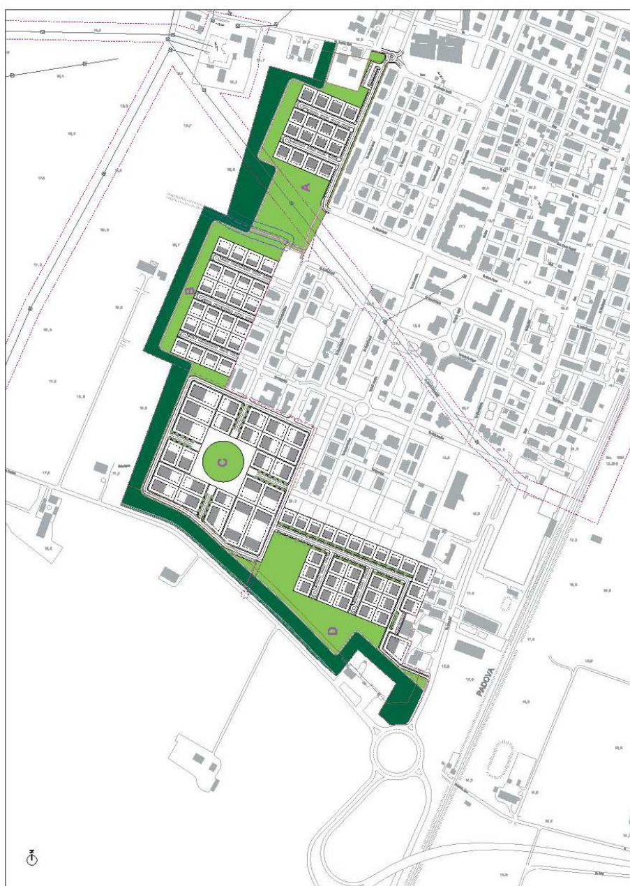
Planimetria generale Areale 3

La pista ciclo pedonale, che lambirà, in larga parte, la fascia boscata lungo tutto il suo percorso fungerà da elemento di mezzo tra i lotti edificabili e le aree verdi. Alcune diramazioni del percorso ciclo pedonale consentiranno di connettere questa zona di nuova espansione con percorsi esistenti frammentati, in particolare lungo via Impastato e via Dalla Chiesa nella parte ad ovest del paese, via Pilati nella parte centrale e via Galliera sud lungo il lato est.